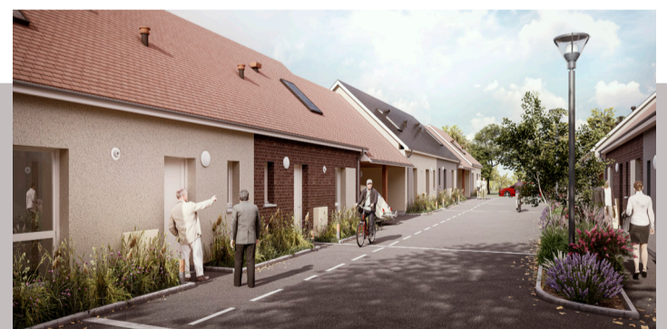
Charleval - Le Clos de la Bouvière

Construction de 24 logements collectifs et 1 individuel Livraison : mai 2022