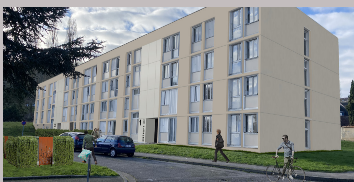
Gaillon - Les Cigognes

Construction de 9 logements individuels Livraison prévisionnelle : 4 ème trimestre 2023