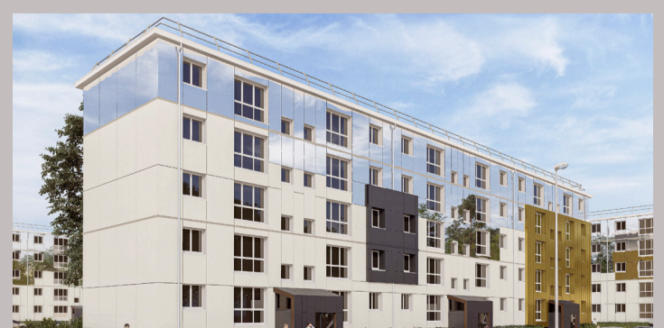
Evreux Nétreville - Place Suffren

Réhabilitation de 50 logements collectifs Livraison : 2 ème semestre 2023