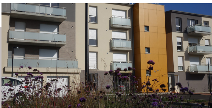
Pacy sur Eure - rue Dulong

Construction de 24 logements collectifs et 1 individuel Livraison : mai 2022